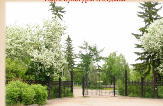
Парк культуры и отдыха

В парке культуры и отдыха проходят детские праздники, танцевально-развлекательные программы, городские мероприятия.