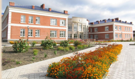
Тарская центральная районная библиотека

Тарская центральная районная библиотека – одна из старейших библиотек в Сибири