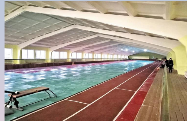
Легкоатлетический манеж КСК «Юбилейный».