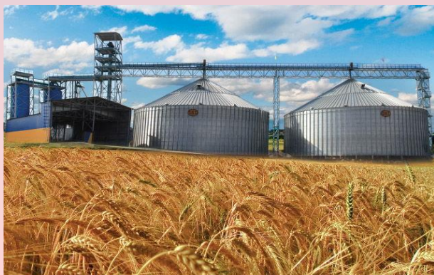
ООО АСП «Краснодарское»