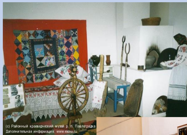
Дополнительная информация: www.ekmu.ru

В экспозиции представлены предметы быта, ремесел, орудия труда, документы, в том числе присутствуют предметы, изготовленные более 100 лет назад. Существует отдел природы. Фонд музея постоянно пополняется.