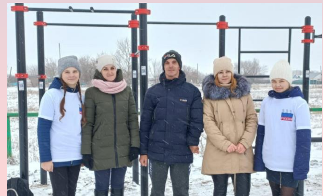
Современная площадка для воркаута в с.Юрьевка

В рамках реализации регионального проекта «Спорт – норма жизни» нацпроекта «Демография» на стадионе спортивного комплекса «Юбилейный» появилась новая площадка ГТО и физкультурно-оздоровительные комплексы.